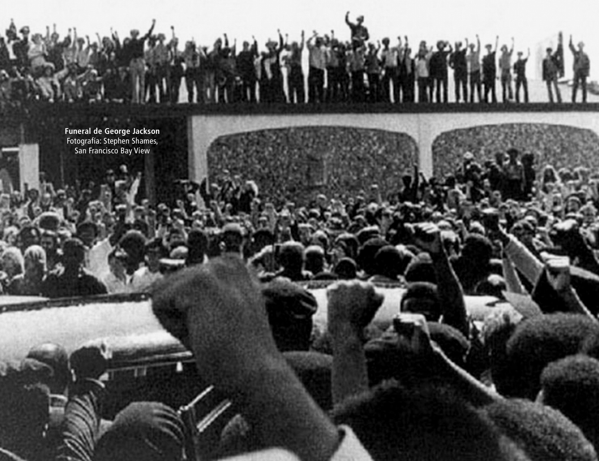
Funeral de George Jackson