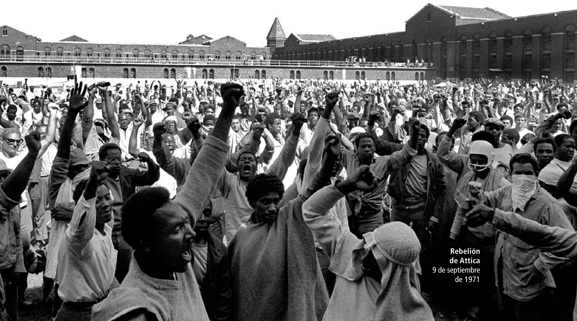
Rebelión de Attica 9 de septiembre de 1971