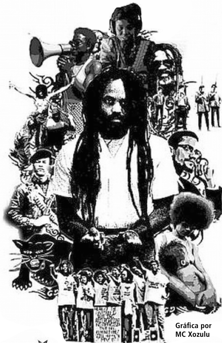
Gráfica por MC Xozulu

De muchas maneras, Agosto Negro empieza en Haití. Es el agosto más negro posible —la Revolución y la liberación de la esclavitud. Durante muchos años, Haití intentó pasar la antorcha de la libertad a todos sus vecinos, al ofrecer apoyo a Simón Bolívar en sus movimientos nacionalistas contra España. De hecho, desde el principio, Haití fue declarado un lugar de asilo para los esclavos fugitivos y un refugio para cualquier persona de ascendencia africana o indio-americana. El 1 de enero de 1804, el presidente Dessalines proclamó: “Nunca más pisará este suelo ningún colono o europeo como amo o terrateniente...” Pero fue el imperialismo estadounidense, no el europeo, el que condenó al pueblo de Haití al régimen cruel de los dictadores. Estados Unidos ocupó a Haití e impuso sus propias reglas y dictámenes... Sin embargo, esa ocupación imperial no borra los logros históricos de Haití. Durante las noches más oscuras de la esclavitud americana, millones de africanos en América del Norte, Brasil, Cuba y más allá pudieron mirar hacia Haití y soñar. 90