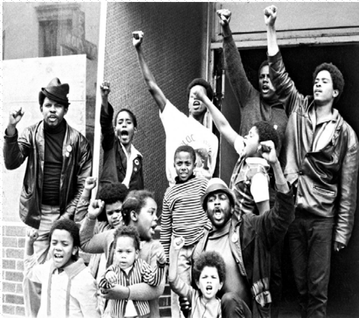
Black Panther Liberation School

—Punto número cinco del Programa de diez puntos del Partido Pantera Negra