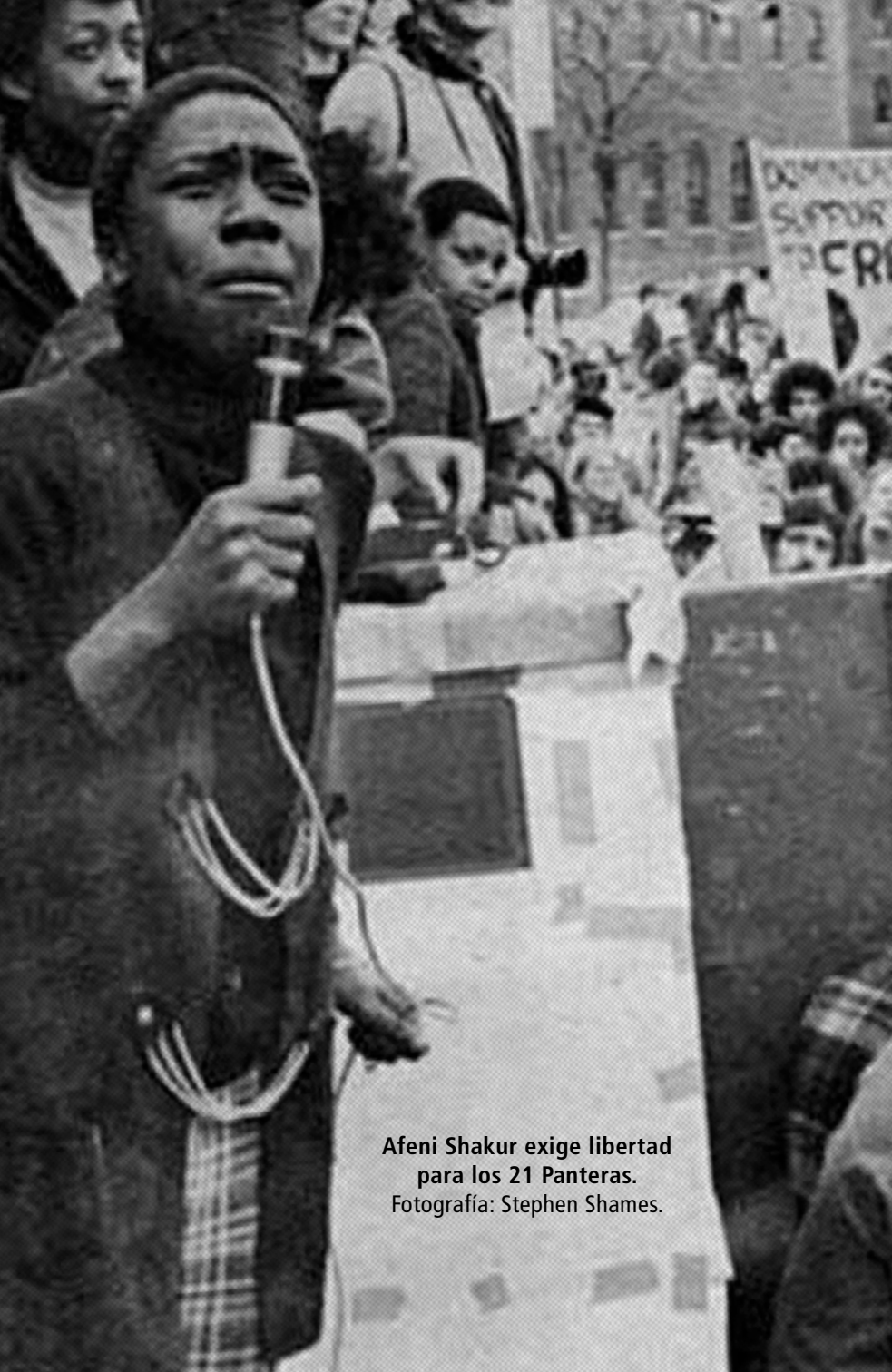
Afeni Shakur exige libertad para los 21 Panteras.